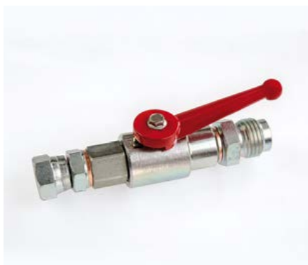
CA5123 RUBINETTO DI RICIRCOLO