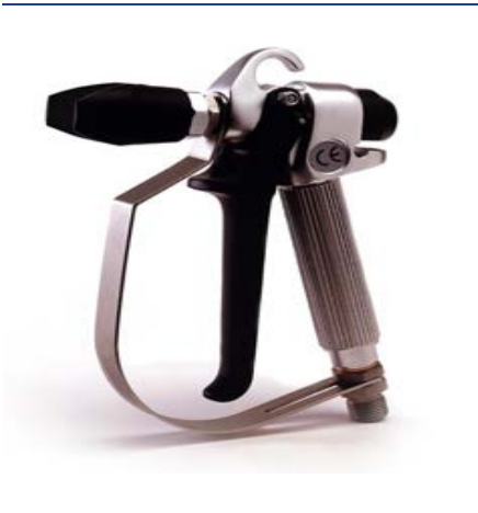
B500 PISTOLA AIRLESS UGELLI DA 9 A 41