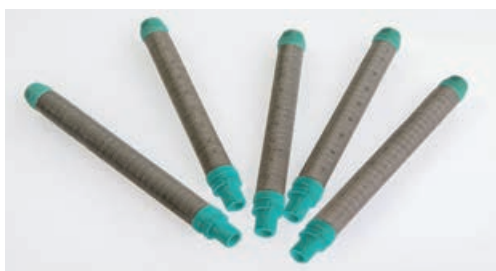
A800017/25 FILTRO CALCIO PISTOLA DA 25 MESH VERDE Conf. 10 pz.