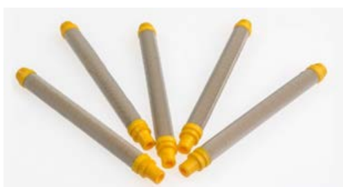
A800017/100 FILTRO CALCIO PISTOLA DA 100 MESH GIALLO Conf. 10 pz.