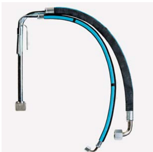
TR9601 SISTEMA DI ASPIRAZIONE PER PITTURE CON FILTRO INOX