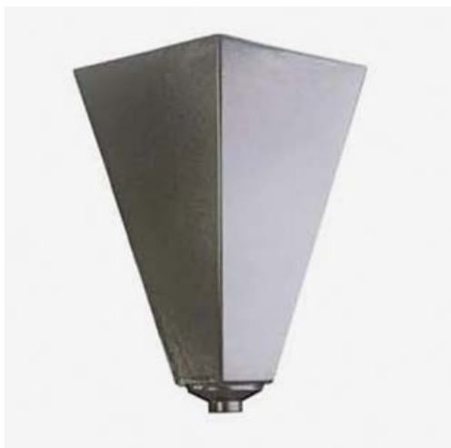
A10715TR SERBATOIO A CADUTA L7 30 COMPLETO DI RITORNO € 280,00