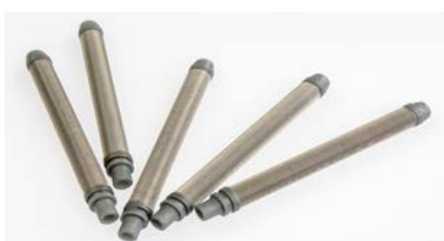
A800017/300 FILTRO CALCIO PISTOLA DA 300 MESH GRIGIO Conf. 10 pz.