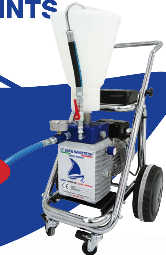
AIRLESS SAFE MARINE M12

POMPE AIRLESS per i professionisti della nautica