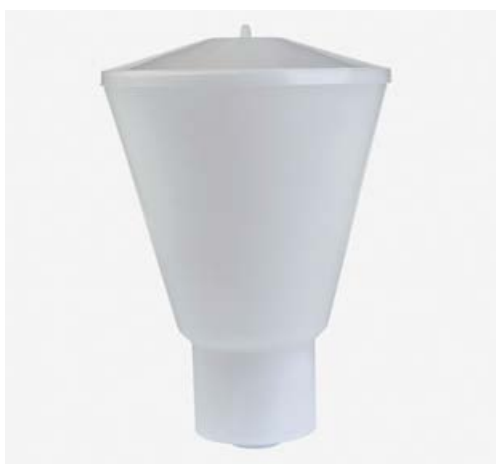
A3771 SERBATOIO A CADUTA LT 6 COMPLETO DI RITORNO