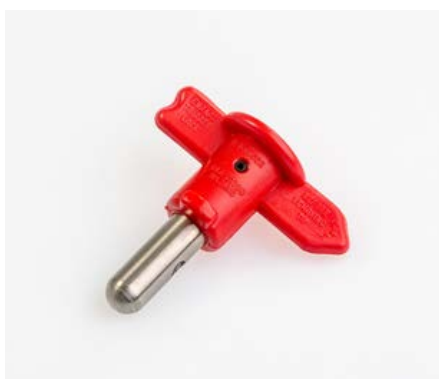
CAZT0000 UGELLO DAL 9 AL 41 SOLO FARFALLA AUTOPULITORE € 60,00