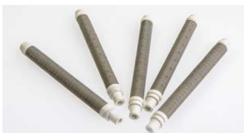
A800017/50 FILTRO CALCIO PISTOLA DA 50 MESH BIANCO Conf. 10 pz.