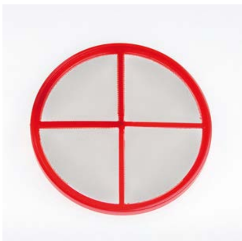
A3772 DISCO FILTRO SERBATOIO IN NYLON € 5,00