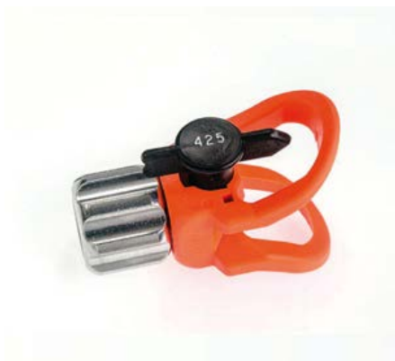
CA 104001 UGELLO AUTOPULITORE ZIP TIP COMPLETO DI BASE € 120,00