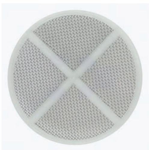
A3772INOX DISCO FILTRO SERBATOIO CON RETE IN INOX € 8,00