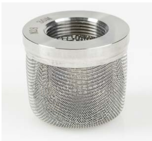
TR9602 FILTRO A TAMBURINO INOX DEL SISTEMA DI ASPIRAZIONE PER PITTURE