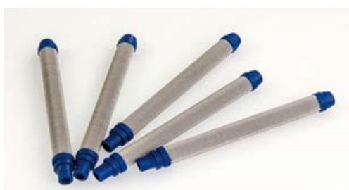
A800017/150 FILTRO CALCIO PISTOLA DA 150 MESH BLU Conf. 10 pz.