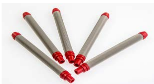
A800017/200 FILTRO CALCIO PISTOLA DA 200 MESH ROSSO Conf. 10 pz.